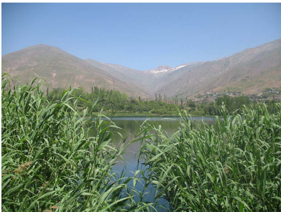
نمایی از پوشش گیاهی اطراف دریاچه اوان