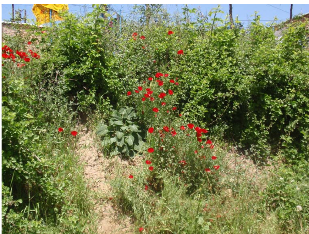
نمایی دیگر از پوشش گیاهی اطراف دریاچه اوان