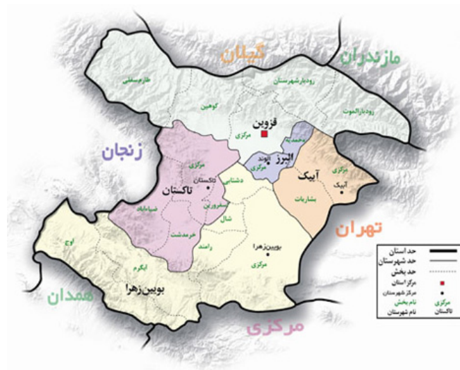
نقشه موقعیت جغرافیایی استان قزوین

در تاریخ ۱۳۸۹/۳/۱۱ در برنامه‌ای به مناسبت میلاد بزرگ بانوی عالم اسلام فاطمه زهرا (س) و بزرگداشت روز زن توسط دفتر مشاور امور زنان شرکت مدیریت منابع آب ایران ترتیب داده شد همکاران این دفتر در معیت سایر بانوان همکار از دریاچه کوهستانی اوان واقع در استان قزوین محدوده الموت بازدید به عمل آوردند در این گزارش به ویژگی های عمومی دریاچه مذکور پرداخته می شود.